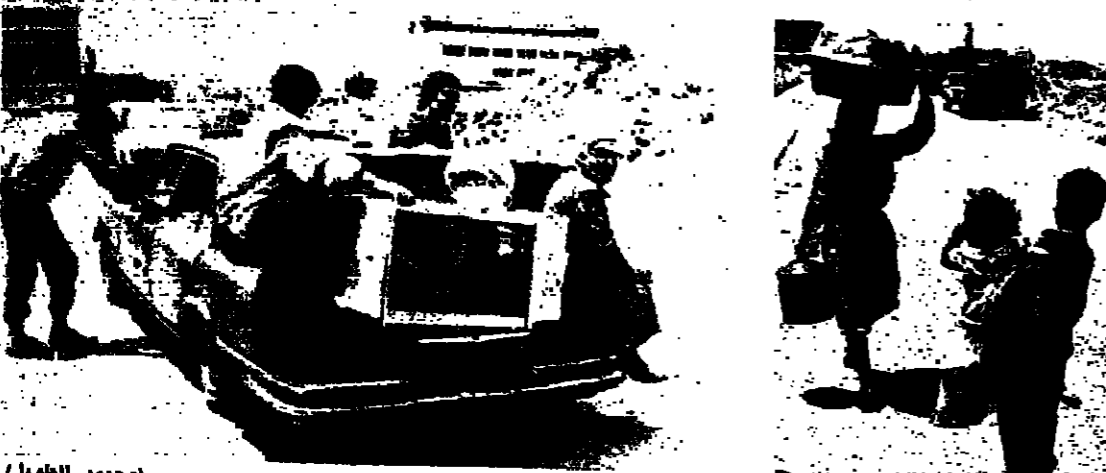
مخيم صبرا (محمود الطويل)